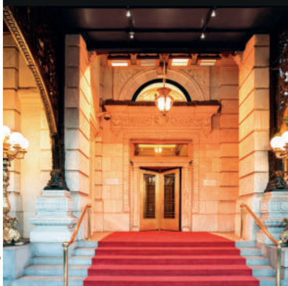
Alle Angaben laut Hersteller