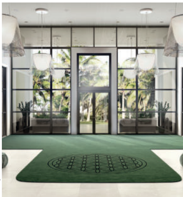
Alle Angaben laut Hersteller

Kontakt/contact: info@vorwerk-teppich.de