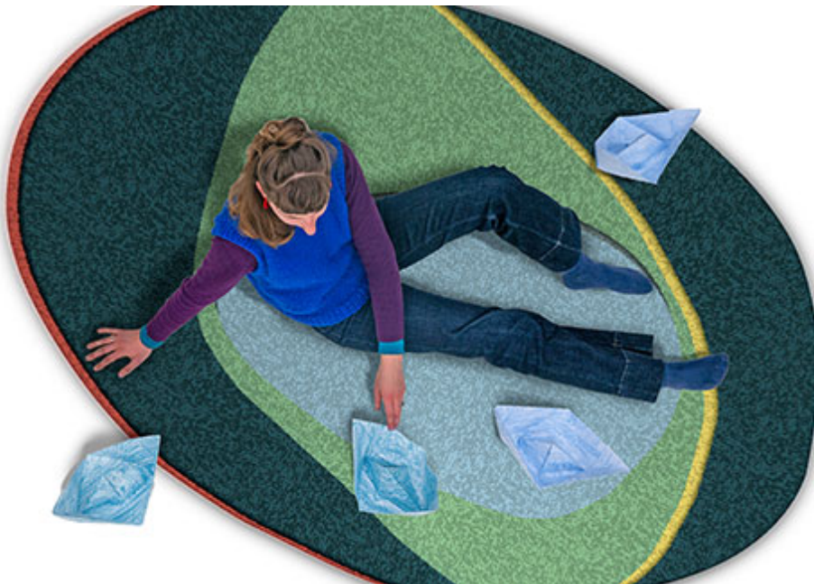
Zora Weidkuhns Teppiche dienen als Zufluchtsort vom Alltag.

Download: Anklicken zum Vergrössern und mit rechter Maustaste herunterladen.