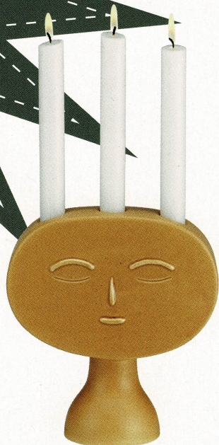
Kerzenständer «Lucia» vom finnischen Möbelhersteller Artek. Erhältlich bei www.vitra.com